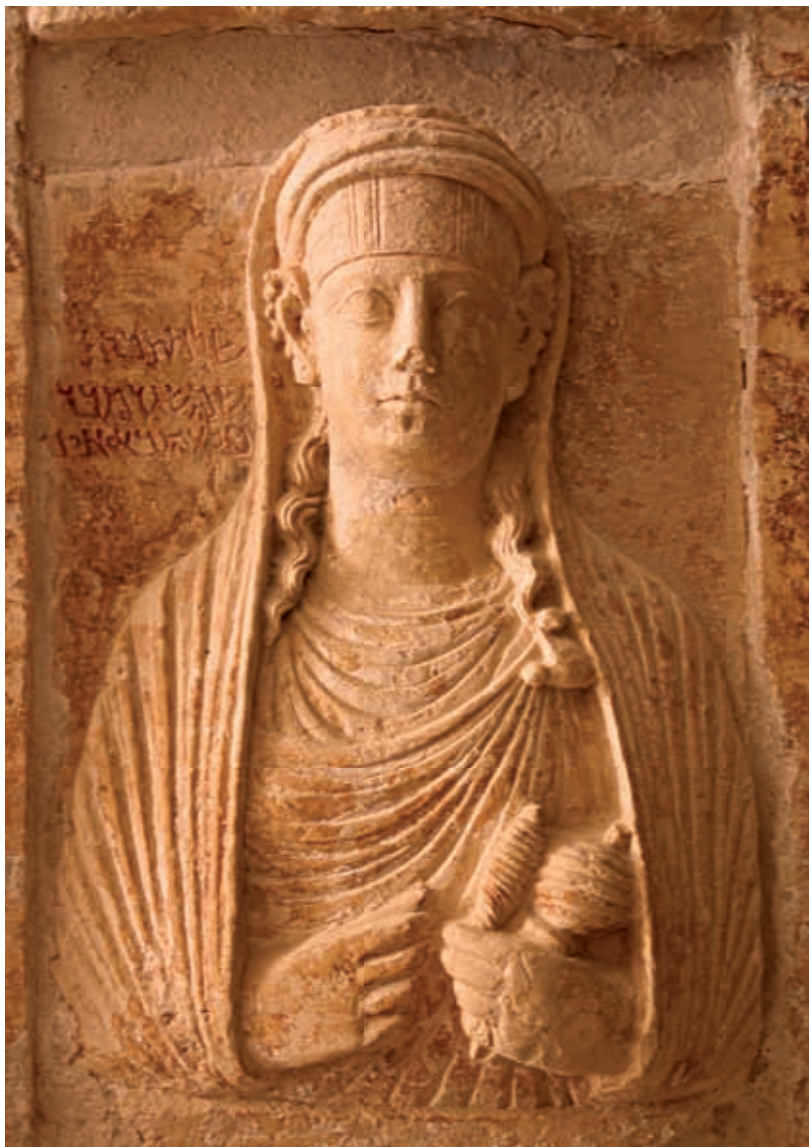
Пальмира. Женский погребальный портрет II в. по Р. Х. (рис. 5)